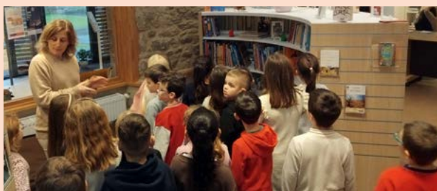
Toutes les classes de l'école se sont rendues à la médiathèque pour emprunter des livres. Elles s'y rendront désormais une fois par mois et pourront participer à différents ateliers (classement des livres, imprimante 3D et crickut).