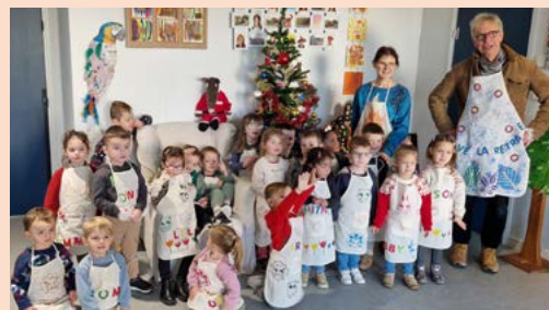
Pour Noël, les TPS-PS-MS ont customisé des tabliers. Le Père Noël de l'Amicale Laïque a dû voir qu'ils avaient bien travaillé. Il est passé à l'école pendant les vacances de Noël et a bien gâté toutes les classes.