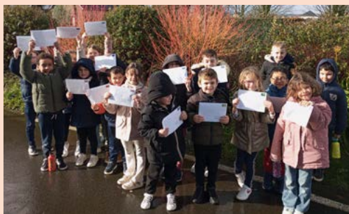
Les CP ont posté leurs cartes de vœux!