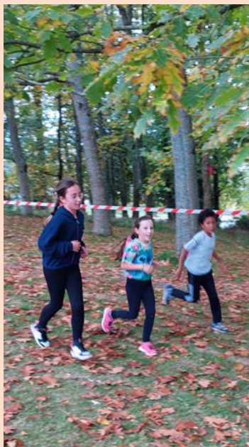
Les élèves de CE2-CM1-CM2 ont participé au cross organisé par le collège Le Volozen de Quintin.

Matinée "Portes-ouvertes" à l'école le samedi 28 mars 2026, de 10h à 12h, cela concerne les futurs TPS et PS ainsi que les nouveaux arrivants sur la commune.