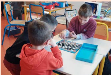
Le dernier après-midi avant les vacances, les CE2-CM1 découvrent différents jeux de société.