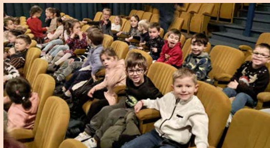
Les classes de maternelle sont allées voir "La petite fanfare de Noël" au cinéma Le Rochonen de Quintin.